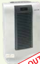
リチウムイオンファンヒーター お部屋に合わせてヒーターの電力2段階切替で節電できます サイズ: 25×14.3×46 cm 重量: 2.95 kg 電源: 100V、50/60Hz、弱-600W 強-1200W