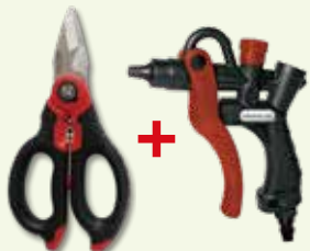
SHINANO オリジナルセット エレクトリックシザーズ(160mm) + エアードスターガン SI-125