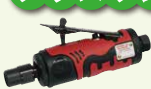
SI-2002EX ダイグラインダー コレットサイズ: 6mm 無負荷回転数: 25,000r.p.m. 全長: 151mm 質量: 0.37kg