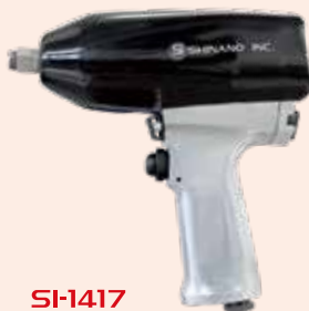
SI-1417 12.7mm 角インパクトレンチ 能力ボルト径: 16mm 最高トルク: 400Nm 全長: 190mm 質量: 2.5kg