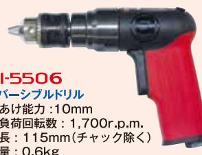
SI-5506 リバーシブルドリル 穴あけ能力: 10mm 無負荷回転数: 1,700r.p.m. 全長: 115mm(チャック除く) 質量: 0.6kg