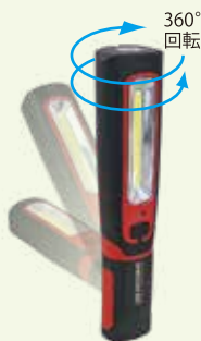
SHINANO オリジナル LED LIGHT 全面発光 COB 方式 リチウムイオン電池 2200mAh 明るさ: 250lm