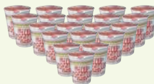
カップヌードル1ケース (20食入り)