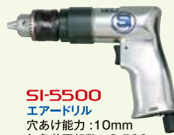
SI-5500 エアードリル 穴あけ能力: 10mm 無負荷回転数: 2,500r.p.m. 全長: 167mm 質量: 0.9kg