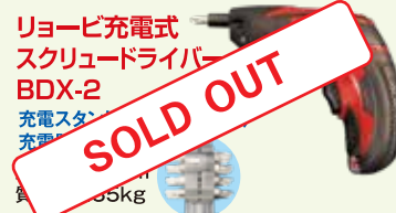
リョービ充電式 スクリュードライバー BDX-2 充電スタンド付