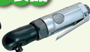
SI-1209 9.5mm 角ミラチャットレンチ 能力ボルト径: 10mm 無負荷回転数: 250r.p.m. 全長: 167mm 質量: 0.55kg