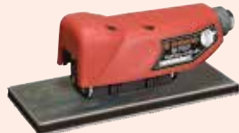
SI-7100 マルチストロークサンダー ペーパーサイズ: 75 × 175mm ストローク長: 5mm 全長: 143mm 質量: 0.5kg