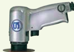
SI-2210 ディスクサンダー ファイバーディスクサイズ: 100φmm 無負荷回転数: 18,000r.p.m. 全長: 167mm 質量: 0.99kg