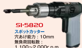
SI-5820 スポットカッター 穴あけ能力: 10mm 無負荷回転数: 1,100~2,000r.p.m. 全長: 115mm(チャック除く) 質量: 0.6kg

●万全を期しておりますがご希望のプラスワン製品・プレミアム製品が品切れの場合は他の製品をお選びください。期間中の納品をもって、終了とさせていただきます。