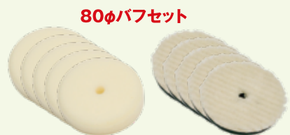
80φバフセット ホワイトウレタンバフ 1パック(5枚入) × 1 ウールバフ 1パック(5枚入) × 1